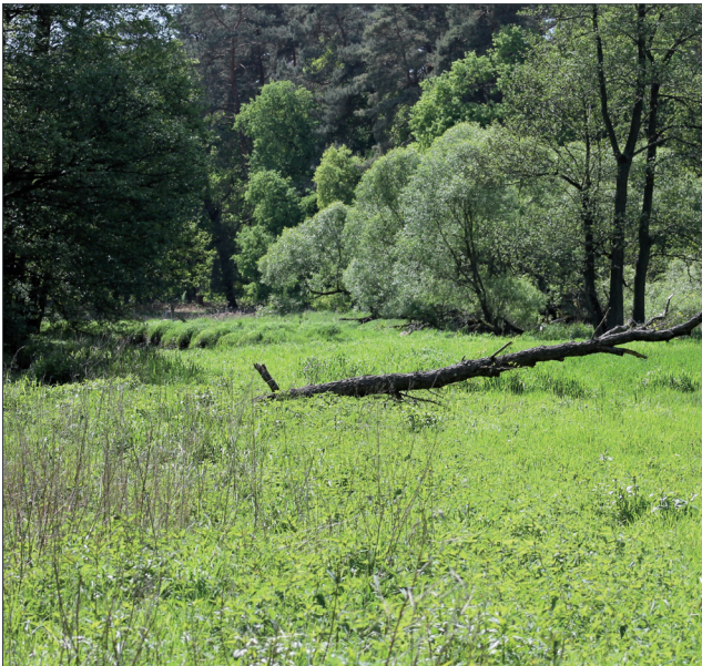
Weidengebüsche und Erlenbruch am Rand des Projektgebietes

knapp 14 Tonnen Kohlendioxidäquivalente pro Hektar und Jahr eingespart werden. Das Emissionsminderungspotenzial der Rehwiese wurde von der Hochschule für Nachhaltige Entwicklung (FH) Eberswalde verifiziert.