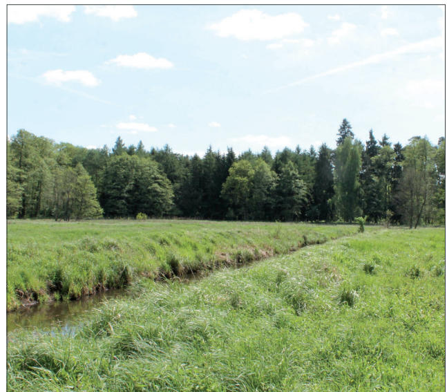
Intensives Grünland mit entwässerndem Graben